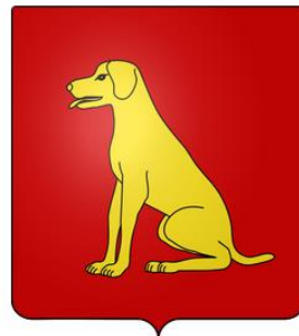
De gueules au bras assis d'or.